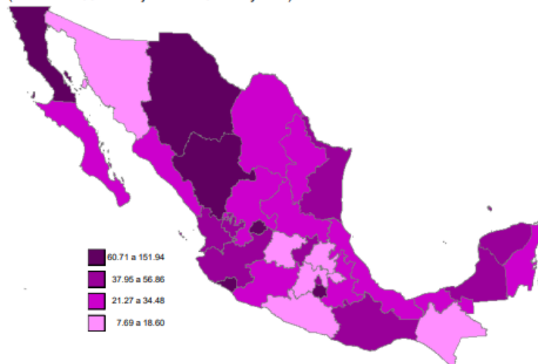
Incidencia de cáncer de mama en mujeres de 20 años y más por entidad federativa 2019 (Por cada 100 mil mujeres de 20 años y más)

Nota: Se utilizó la Clasificación Estadística Internacional de Enfermedades y Problemas Relacionados con la Salud (CIE-10), código C50. Excluye casos con edad no especificada. Fuentes: SALUD, Dirección General de Epidemiología (DGE). (2021). Anuarios de Morbilidad 1984-2019. CONAPO (2018). Proyecciones de la Población de México y de las Entidades Federativas, 2016-2050.