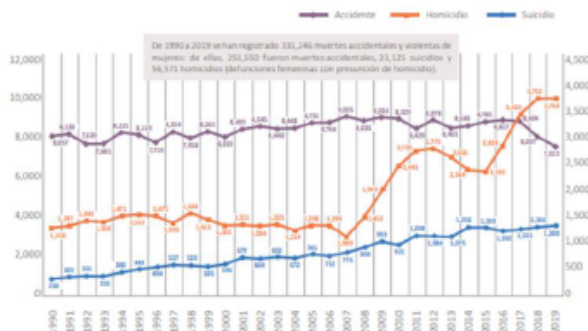
Gráfica 1. México: número de muertes de mujeres accidentales y violentas (suicidios y defunciones femininas con presunción de homicidio), 1990-2019

- En 12 años el suicidio de mujeres en México se incrementó en 60.2%.